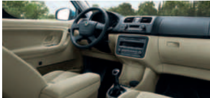
Roomster Comfort Plus Edition: Interieur Chess-Beige oder Chess-Schwarz, Armaturentafel in Schwarz oder Schwarz/Beige.