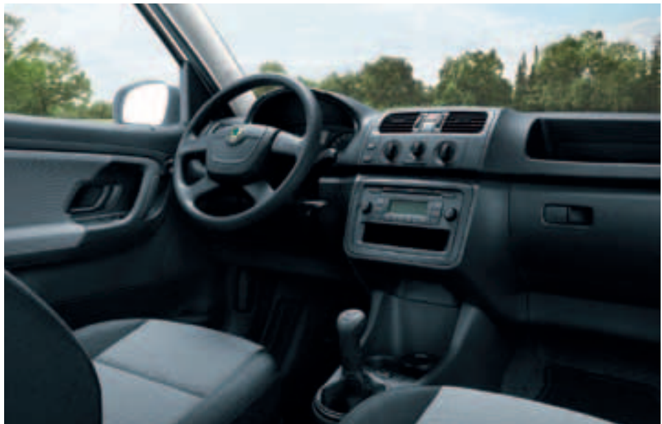
Roomster Plus Edition: Interieur Roomster-Grau, Armaturentafel in Schwarz.

Der ŠKODA Roomster Plus Edition . Das Sondermodell bietet eine Vielzahl komfortabler Extras. Sie sorgen dafür, dass eine Fahrt im Roomster noch entspannter wird. Und das bei einem Preisvorteil von 1.275,- € .