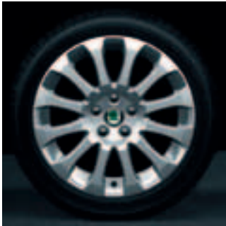
Leichtmetallfelgen Comet 6,5J x 16" mit 205/45 R16-Bereifung

Das dynamische Kurvenlicht passt sich Ihren Lenkbewegungen an, wodurch der Verlauf der Straße früher erkennbar wird. Zusätzlich leuchten die Nebelscheinwerfer mit Abbiegelichtfunktion den Bereich seitlich des normalen Scheinwerferlichts aus.