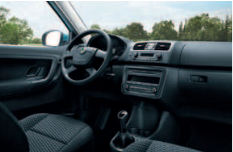
Roomster Style Plus Edition: Interieur Domino-Schwarz oder Domino-Grau, Armaturentafel in Schwarz.

Der ŠKODA Roomster Style Plus Edition . Wenn Sie den Roomster noch stilvoller ausstatten möchten, empfehlen wir Ihnen den Roomster Style Plus Edition. Er umfasst zahlreiche Sonderausstattungen, wie zum Beispiel beheizbare Vordersitze und einen höheinstellbaren Beifahrersitz . Und das alles zu einem Preisvorteil von 1.100,- € .