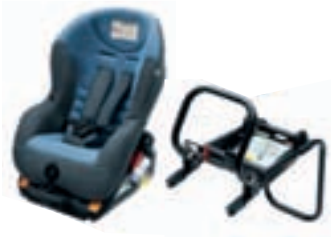
Isofix G 0/1 Kindersitz mit ISO-Befestigungsrahmen (RWF) für die Montage entgegen der Fahrtrichtung