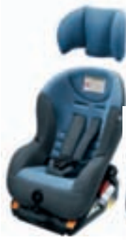
Isofix G 0/1 Kindersitz mit ISO-Befestigungsrahmen (FWF) für die Montage in Fahrtrichtung und Kopfstütze