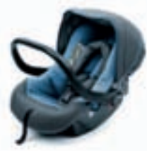
Baby One Plus Kindersitz

Damit Ihre kleinen Reisegefährten auf jeder Fahrt optimal geschützt sind, bieten wir Ihnen für jedes Alter Ihres Kindes das passende Modell aus unserer ŠKODA Original Kindersitz-Reihe an.