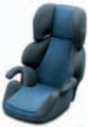
Wavo 1-2-3 Kindersitz