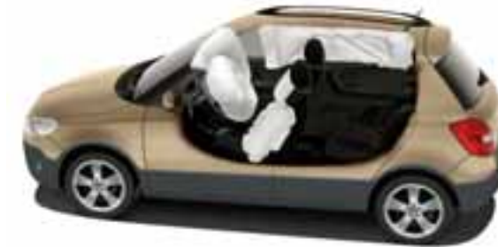
Fahrer- und Beifahrerairbag sowie Seitenairbags vorn und Kopfairbags sind beim Fabia Scout serienmäßig.

Beim Fabia Scout ist das Thema Sicherheit vor allem eins: kein Thema. Dank der zahlreichen aktiven wie passiven Fahrsicherheitssysteme brauchen Sie sich um den Schutz der Insassen keine Gedanken zu machen. ESC, EDS, ASR sowie ein Bremsassistent sorgen durch gezielte Eingriffe ins Motoren- und Bremsmanagement dafür, dass Ihr Fahrzeug sicher in der Spur bleibt. Für den Fall der Fälle verfügt der Fabia Scout serienmäßig über Fahrer- und Beifahrerairbag sowie Seitenairbags vorn und Kopfairbags. Sie aktivieren sich bei Bedarf innerhalb von Millisekunden und schützen die Passagiere sowohl im vorderen als auch im hinteren Teil des Autos. Das Tagfahrlicht in den Halogen-Projektorscheinwerfern und die Nebelscheinwerfer stellen sicher, dass Ihr Weg auch bei Dunkelheit perfekt ausgeleuchtet ist. Wohin Sie mit Ihrem Fabia Scout auch wollen, ein sicheres Gefühl ist stets mit dabei.